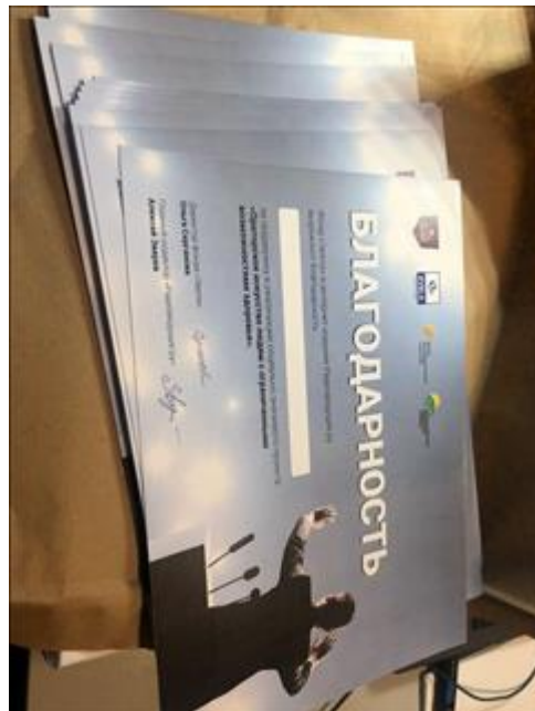
Благодарности для участников мероприятий Фото благодарностей для партнеров проекта, тираж 20 шт.